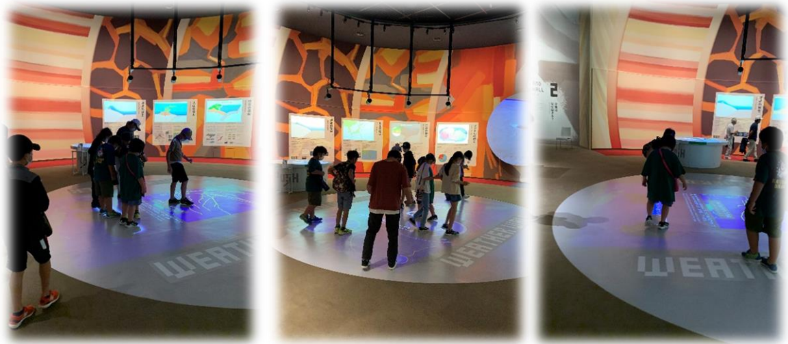
台風になって自分で動かしている子どもたち。