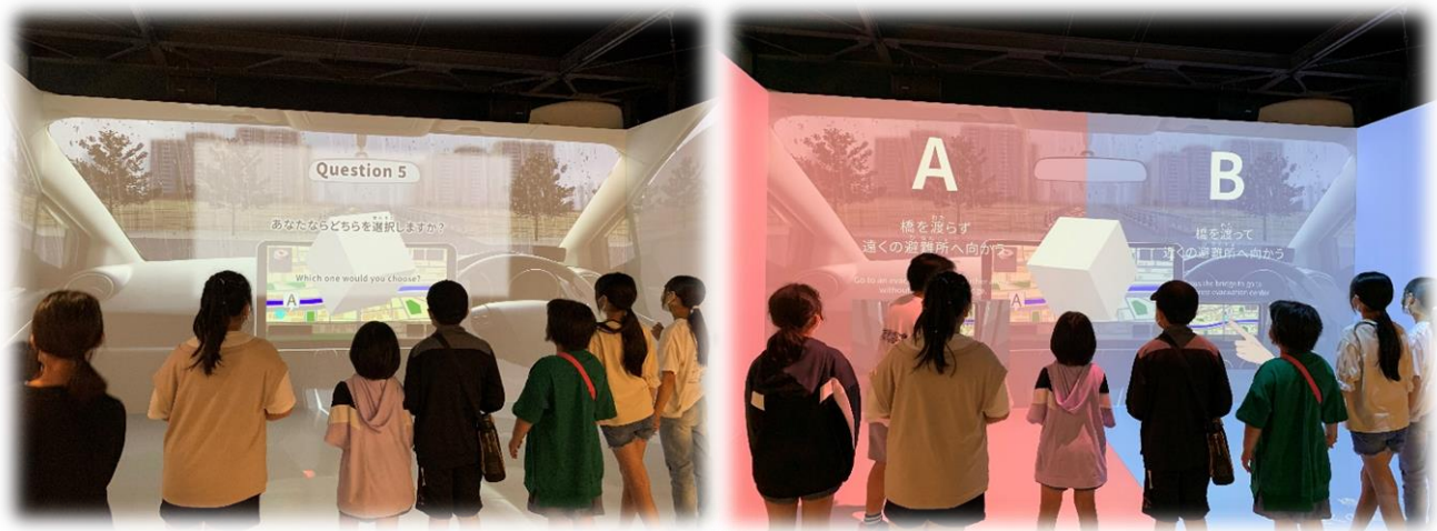
クイズに挑戦！災害が起きたらどうする？